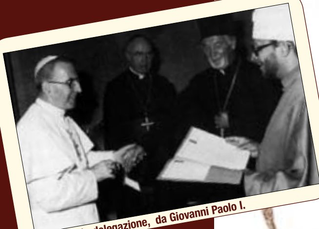
In visita, in delegazione, da Giovanni Paolo I.