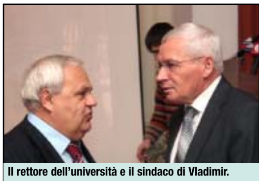
Il rettore dell'università e il sindaco di Vladimir.